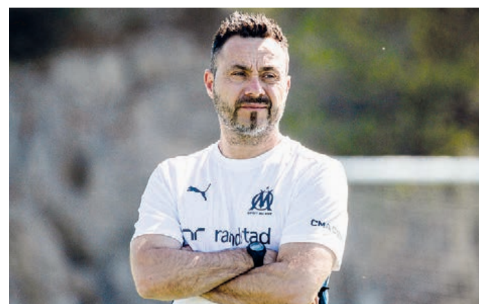
ROBERTO DE ZERBI - ALLENATORE MARSIGLIA

C hi conosce o ha conosciuto Roberto De Zerbi sa perfettamente che una sconfitta come quella subita con il PSG non può essere accettata. Un'intera settimana a provare il modo di arrestare il gioco sugli esterni dei ragazzi di Luis Enrique ed ecco che dopo appena 7 minuti il suo OM va sotto proprio con costruzione Barcola - Nuno Mendes, i due di fascia mancina (che dovevano essere controllati da Greenwood) i quali invece hanno cambiato subito il corso del Classico più atteso al Velodrome. Nel complesso della partita, non è comunque stato il Marsiglia del tecnico bresciano. I suoi sono usciti tra i fischi dei supporters e in campo si sono visti i vari Rabiot e Hojberg lamentarsi vistosamente con l'at-