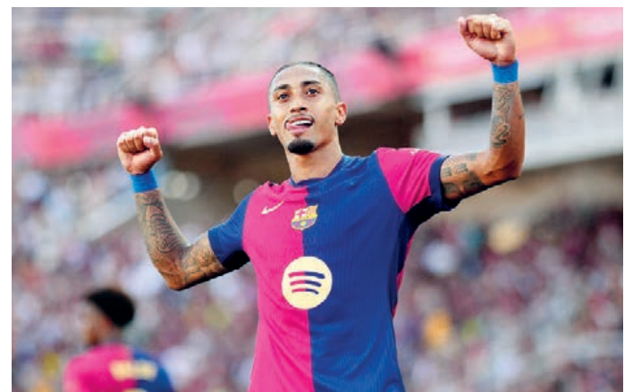
RAPHINHA - ATTACCANTE BARCELONA

Il Barça sta dominando la Liga, come nemmeno il più acceso hincha culé avrebbe mai potuto pensare soprattutto dopo che Xavi era stato licenziato perché non credeva che i blaugrana potessero competere con l'opulenza del Real di Mbappé. E invece Flick ha costruito una macchina quasi perfetta. E la dimostrazione non è tanto - per paradosso ovviamente - il 4-0 rifilato alle merengues em pleno Bernabeu, perché lì - in fondo - le motivazioni erano al diapason, quanto l'autorità con cui la settimana successiva (tra l'altro in un clima luttuoso che poteva far calare l'attenzione) ha regolato l'Espanyol. Flick ha tantissime frecce al suo arco: il miglior Raphinha di sempre (vedi box), uno Yamal oramai incollato a Vi-