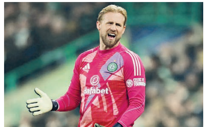
KASPER SCHMEICHEL - PORTIERE CELTIC

L a Premiership scozzese riparte nel weekend, con la solita netta favorita: il Celtic, vincitore di 13 degli ultimi 15 campionati. E, nei due anni in cui non hanno vinto (2011 e 2021), i biancoverdi sono arrivati secondi. Gli unici rivali possibili sono i Rangers, nella scorsa stagione distanziati però di ben 17 punti. Per prepararsi al debutto ufficiale del 2025-26 e, soprattutto, all'importantissimo playoff di Champions League, previsto tra il 19 e il 27 agosto (il sorteggio sarà effettuato lunedì 4), il club di Glasgow è passato anche dall'Italia, disputando, qualche giorno fa, la "Como Cup". Senza lasciare ricordi memorabili, sia per i risultati (1-5 con l'Ajax, poi 1-1 e vittoria ai rigori con i sauditi dell'Al Ahli) sia per gli incidenti tra tifosi che ci sono stati alla fine del